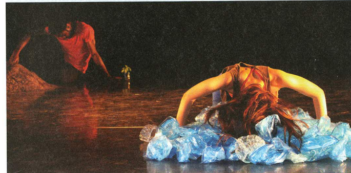
Die Tchekpo Dance Company führt am 16. Nov. „Mmiri mizu water“ auf.

BRILLEN SONNENBRILLEN KONTAKTLINSEN GLEITSICHTOPTIK