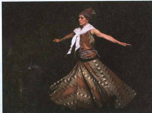
Auftritt am 16. Nov.: Cie Oxana Chi.

tion Arts Vagabonds Rézo Afrik Bénin und seit 2001 in Benin in Sachen soziokultureller Mobilisierung mit künstlerischen Mitteln aktiv. Die Biennale Passages widmet sich der Entwicklung des zeitgenössischen Tanzes des Kontinents Afrika und möchte eine lebendige Auseinandersetzung mit der Gegenwart der