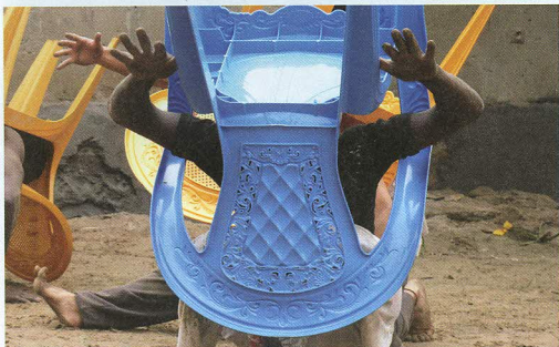
Auftritt am 13. Nov.: Studio Maho.